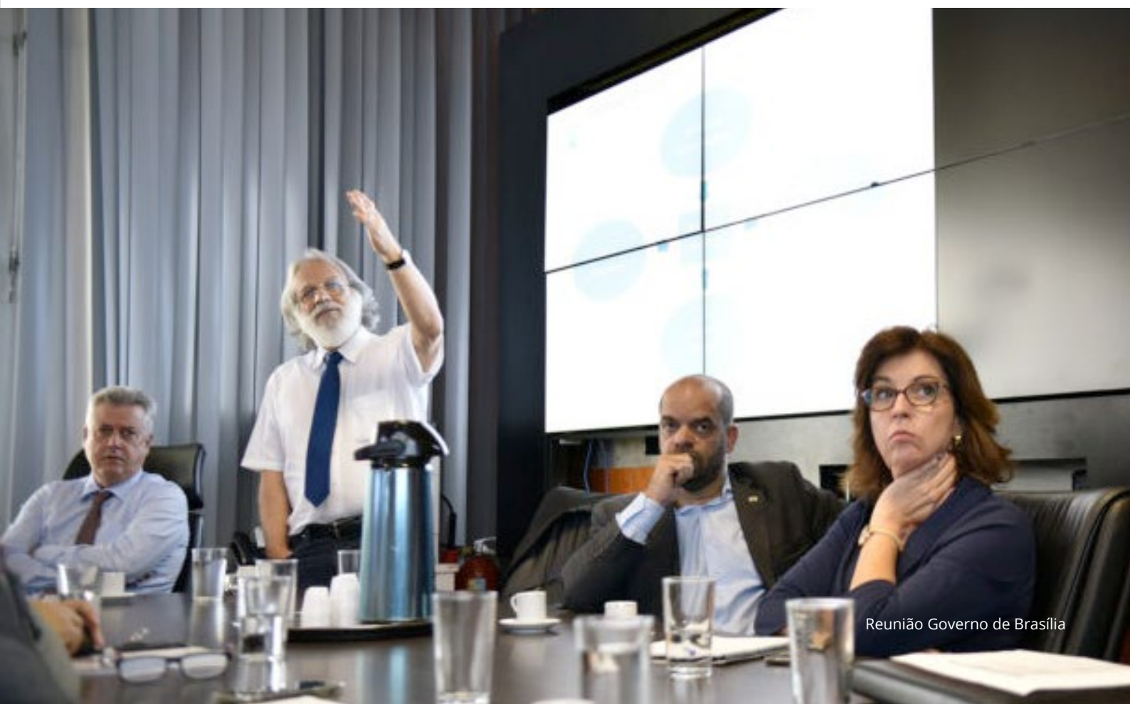
Reunião Governo de Brasília

De forma resumida y práctica, la actuación de la Adasa se dio en 5 (cinco) grandes bloques: Expo; Villa Ciudadana; Villa Criança Candanga; Acciones Complementarias y Actividades Extras. En los últimos seis meses que precedieron al 8º Forofueron realizadas, sólo por la ATE, 217 reuniones con 46 diferentes grupos.