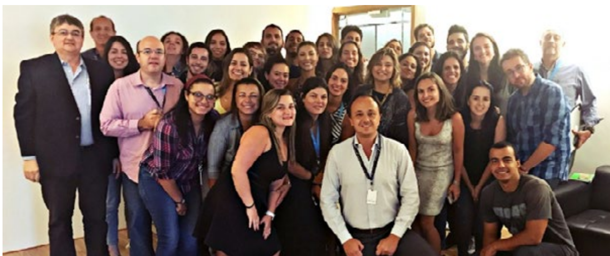
Secretariado e equipe PCO.